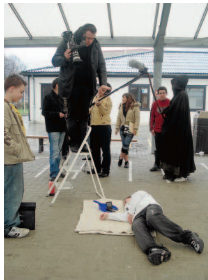
Le film a été tourné sur le campus du Céria.